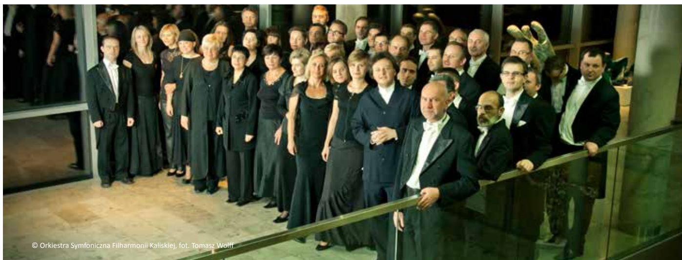
© Orkiestra Symfoniczna Filharmonii Kaliskiej, fot. Tomasz Wolff