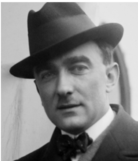
Karol Szymanowski

rze Harnasiów w paryskiej operze. Umiera w klinice w Lozannie. Jego ciało zostaje złożone w Krakowie, w Krypcie Zasłużonych. Pośmiertnie zostaje odznaczony Krzyżem Wielkim Orderu Odrodzenia Polski I klasy. Uroczysty pogrzeb, zorganizowany na koszt państwa, zdaje się być czymś, co Szymanowski doskonale przewidział. Z listu do przyjaciela: „Polska oficjalna (rząd) stanowczo nie chce mnie uznać. Posługuje się mną wyłącznie wtedy, kiedy jestem niezbędny dla propagandy. Faktem jest, że tu gwizdzą się na mnie i że mógłbym zginąć z głodu, a nikt by palcem nie ruszył. Inna rzecz z moim przyszłym pogrzebem. Będę wspomniany, tego jestem pewien. Tutaj uwielbia się uroczystości żałobne i wielkich zmarłych”.