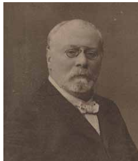
Zygmunt Noskowski — 1918

ORKIESTRA SYMFONICZNA FILHARMONII KALISKIEJ — Zespół nagrodzony Grammy Award 2014 w kategorii Best Large Jazz Ensemble Album za płytę Night in Calisia . Historia ostatniego sukcesu orkiestry, który przyniósł jej największy rozgłos, jest ściśle związana z Kaliszem. Z okazji jubileuszu 1850-lecia Kalisza zamówiono u Włodka Pawlika utwór Night in Calisia . W koncercie wzięli udział: legendarny trębacz Randy Brecker, Włodek Pawlik Trio oraz Orkiestra Symfoniczna Filharmonii Kaliskiej pod dyrekcją