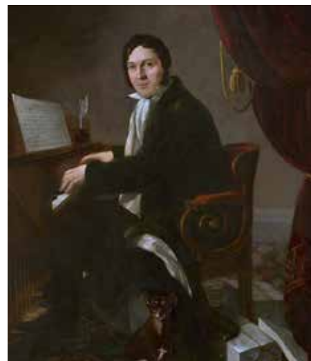
Aleksander Ludwik Molinari, Karol Kurpiński , 1825, Muzeum Narodowe w Warszawie, wikipedia.org (CC BY-SA)

W swojej twórczości łączył klasyczne środki formalne — inspirując się Haydnem i Mozartem — z elementami polskiego folkloru (melodiami ludowymi i tańcami), co typowe było dla kompozytorów przełomu klasycyzmu i romantyzmu. Znany jest z dzieł wokalnie-instrumental-